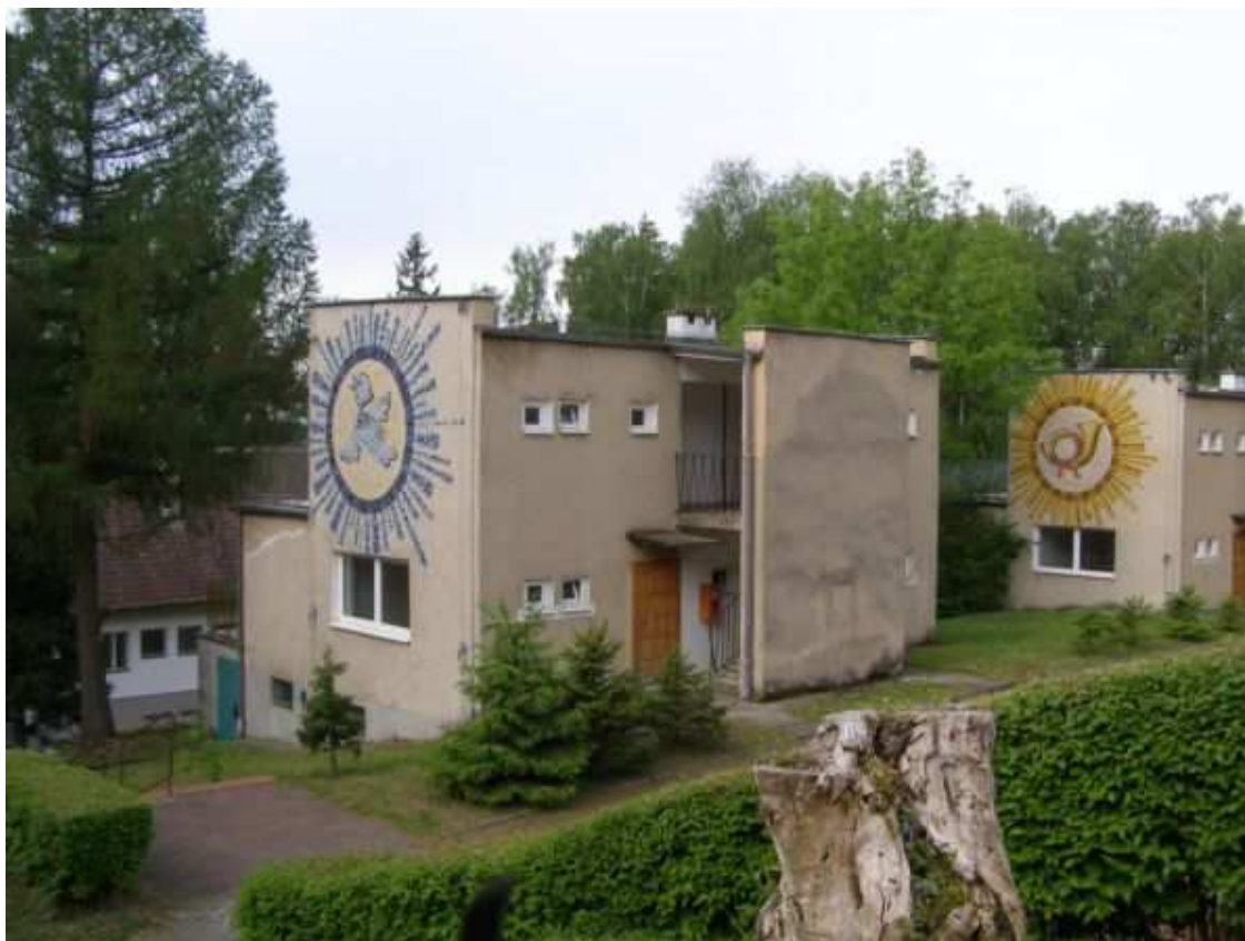
Ińsko, ul. Orzechowa 1, gmina Ińsko Szczecin, kwiecień 2013 r.