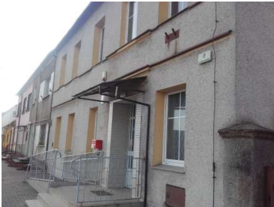
widok budynku od frontu