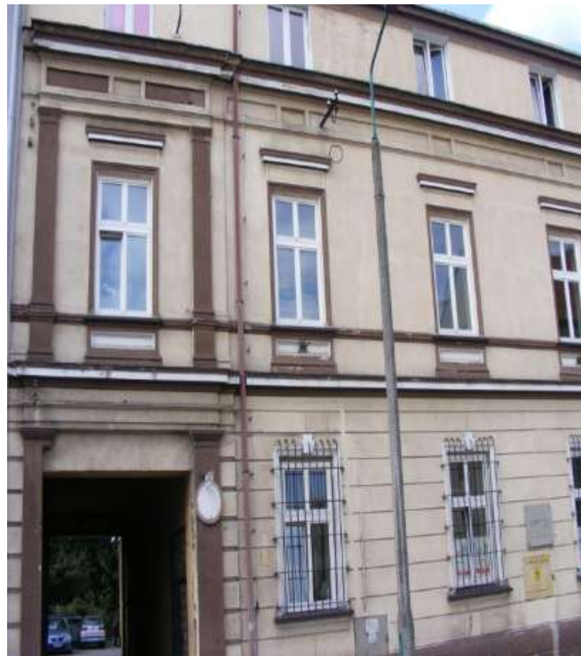
Zdjęcie przedmiotu wynajmu