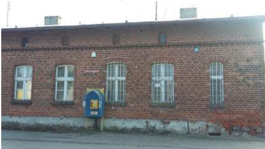
widok budynku od frontu