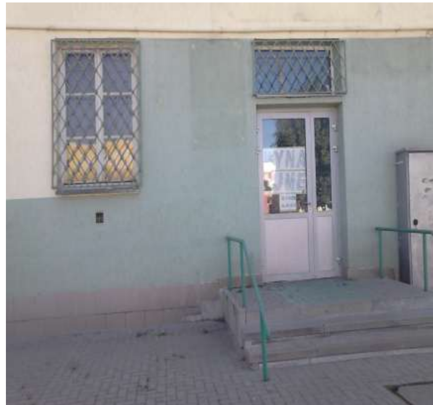
Zdjęcie przedmiotu najmu

Wadium: 1846,40zł (słownie: jeden tysiąc osiemset czterdzieści sześć złotych i czterdzieści groszy )