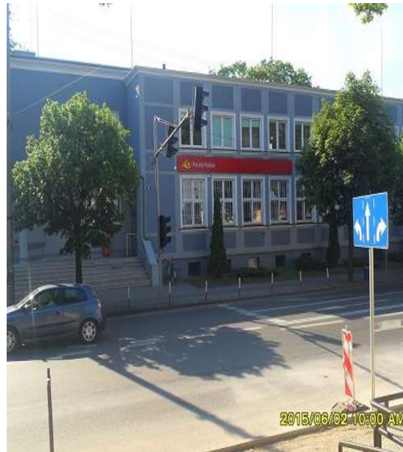
Skierniewice ul. Henryka Sienkiewicza 2