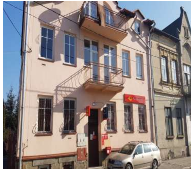
Zdjęcie przedmiotu wynajmu