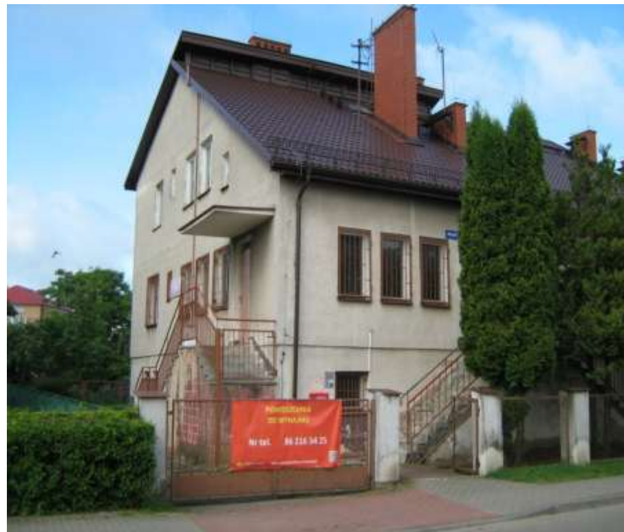
Budynek Poczty Polskiej S.A. w Zawadach