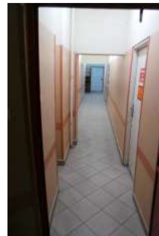
Pomieszczenia biurowe – I piętro