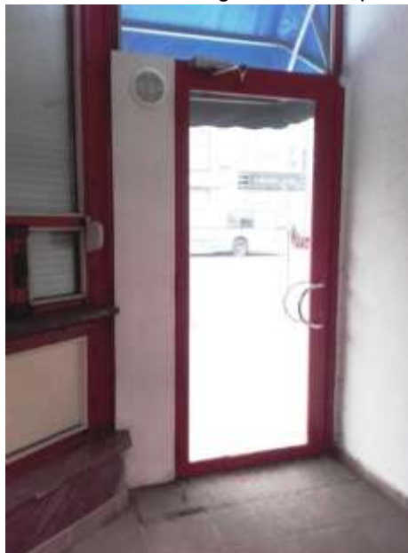
Pomieszczenie usługowe nr 29 – parter

Niezależnie od czynszu Najemca będzie ponosił opłaty eksploatacyjne za: energię elektryczną, wodę, odprowadzanie ścieków, centralne ogrzewanie.