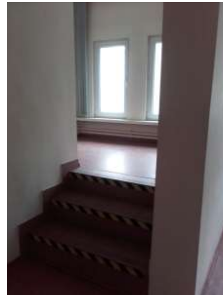
Pomieszczenia wspólne – I piętro