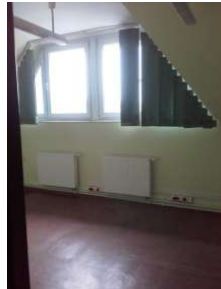
Pomieszczenia wspólne – poddasze