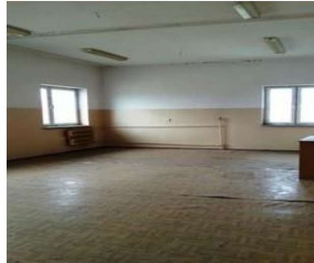
Lokal nr 1