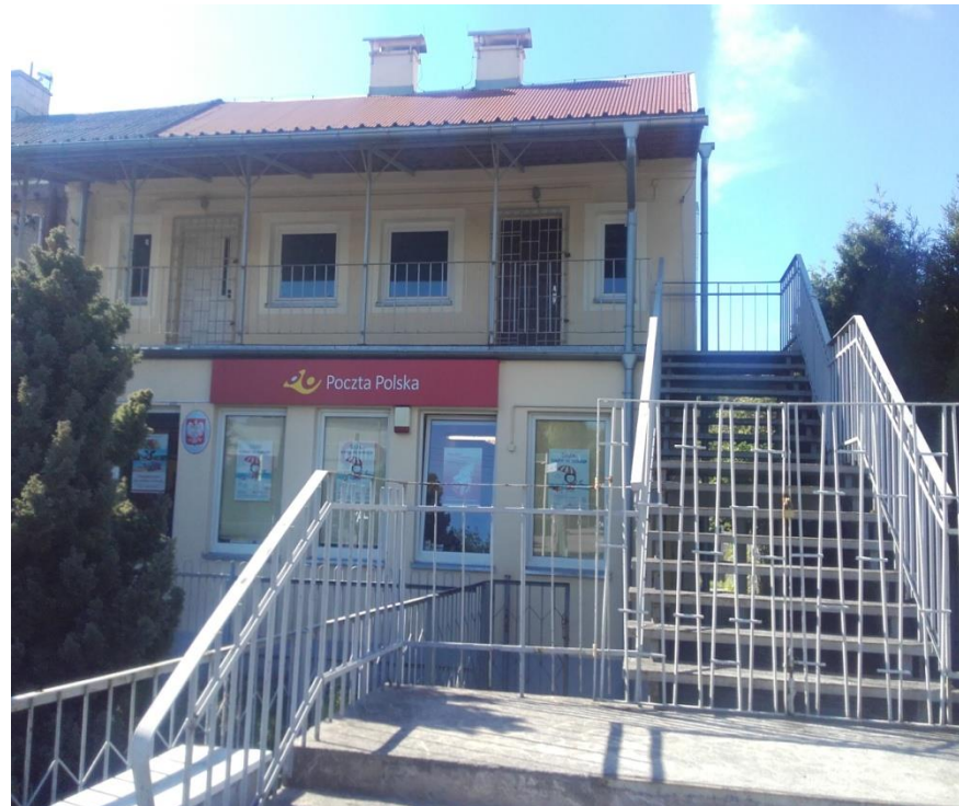
Zdjęcie przedmiotu najmu

Treść obwieszczenia znajduje się na stronach 5, 6 i 7 niniejszej prezentacji.