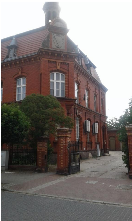
Wejście do lokalu mieszkalnego - prawa strona