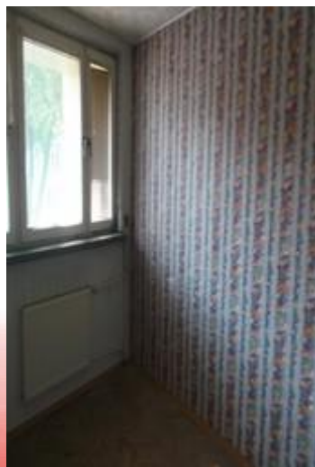
Lokal Nr 1 - Łazienka