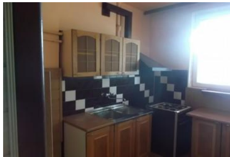
Lokal Nr 1 - Kuchnia