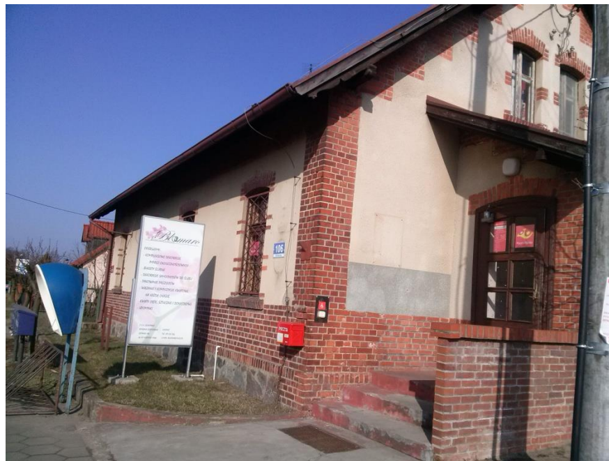
Zdjęcia Budynku Poczty Polskiej S.A. przy ul. Główniej 106