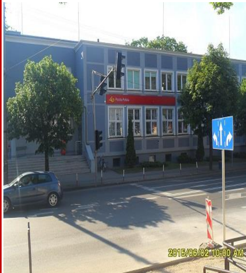
Skierniewice ul. Henryka Sienkiewicza 2