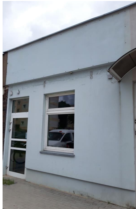
Budynek usługowy Poczty Polskiej S.A. w Elblągu, przy ul. Nowowiejskiej 1

Miejsce składania ofert: Poczta Polska S.A. Centrum Infrastruktury Ośrodek Infrastruktury w Białymstoku, ul. Kolejowa 26, 15-959 Białystok